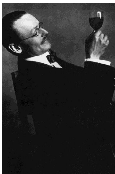
Hermann Hesse, 1910