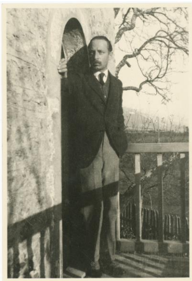
Rainer Maria Rilke, 1923